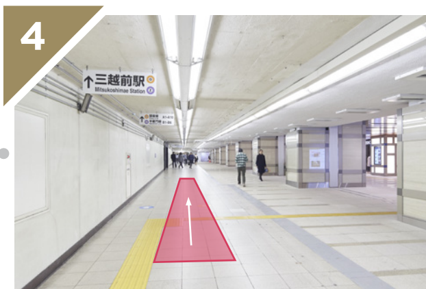
「三越前駅」方面へ向かいます。