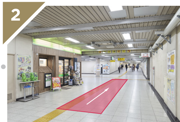
NewDaysを左手に見ながら直進します。