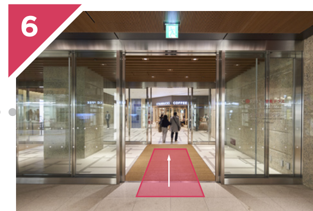
正面が「COREDO室町テラス」です。