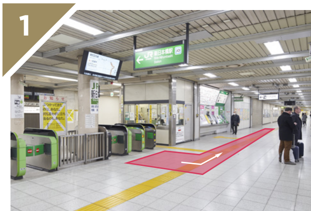
改札口を出たら左に進みます。