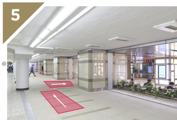
「三越前駅」の手前で右に曲がります。